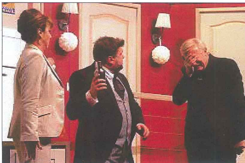
Les comédiens, pendant près de deux heures, ont su convaincre les spectateurs présents.